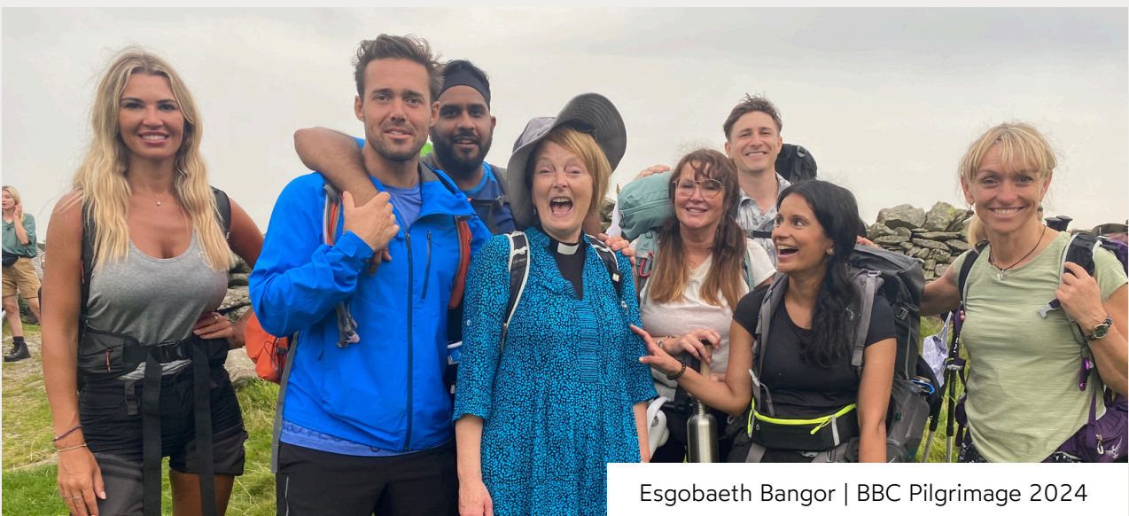
Esgobaeth Bangor | BBC Pilgrimage 2024

Rydym yn eich croesawu i ymuno â ni yn y genhadaeth drawsnewidiol hon, wrth i ni wneud ein ffordd trwy heriau ein hamser gyda ffydd, ymroddiad, ac ymrwymiad i addoli, twf a chariad.