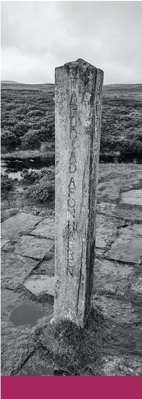
Tarddiad yr Hafren | The source of the Severn