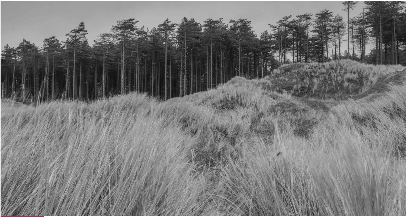
Twyni Niwbwrch The sands at Newborough

manwl, ar gyfer y ffordd rydym i fyw y mae'r disgrifiadau trawiadol, maent yn dangos y modd, yn y dechreuad, yr oedd y Creawdwr yn dymuno y byddai yna berthynas gydnaws rhwng y creaduriaid a'r cread. Cafodd y berthynas honno ei niweidio, ond nid ei dinistrio, gan anufudd-dod y ddynoliaeth, a thrwy ddyfodiad Iesu cafodd ei hiacháu tu hwnt i bob disgwyl. Yn y diwedd, mae'r iachâd hwnnw yn amlwg yn cael ei gynnig i bawb, nid yn unig i'r rhai sy'n sicr eu bod wedi'u 'hachub', wrth i'r 'cenhedloedd' gael eu croesawu i ddinas Duw (Datguddiad 21: 24 – 26).