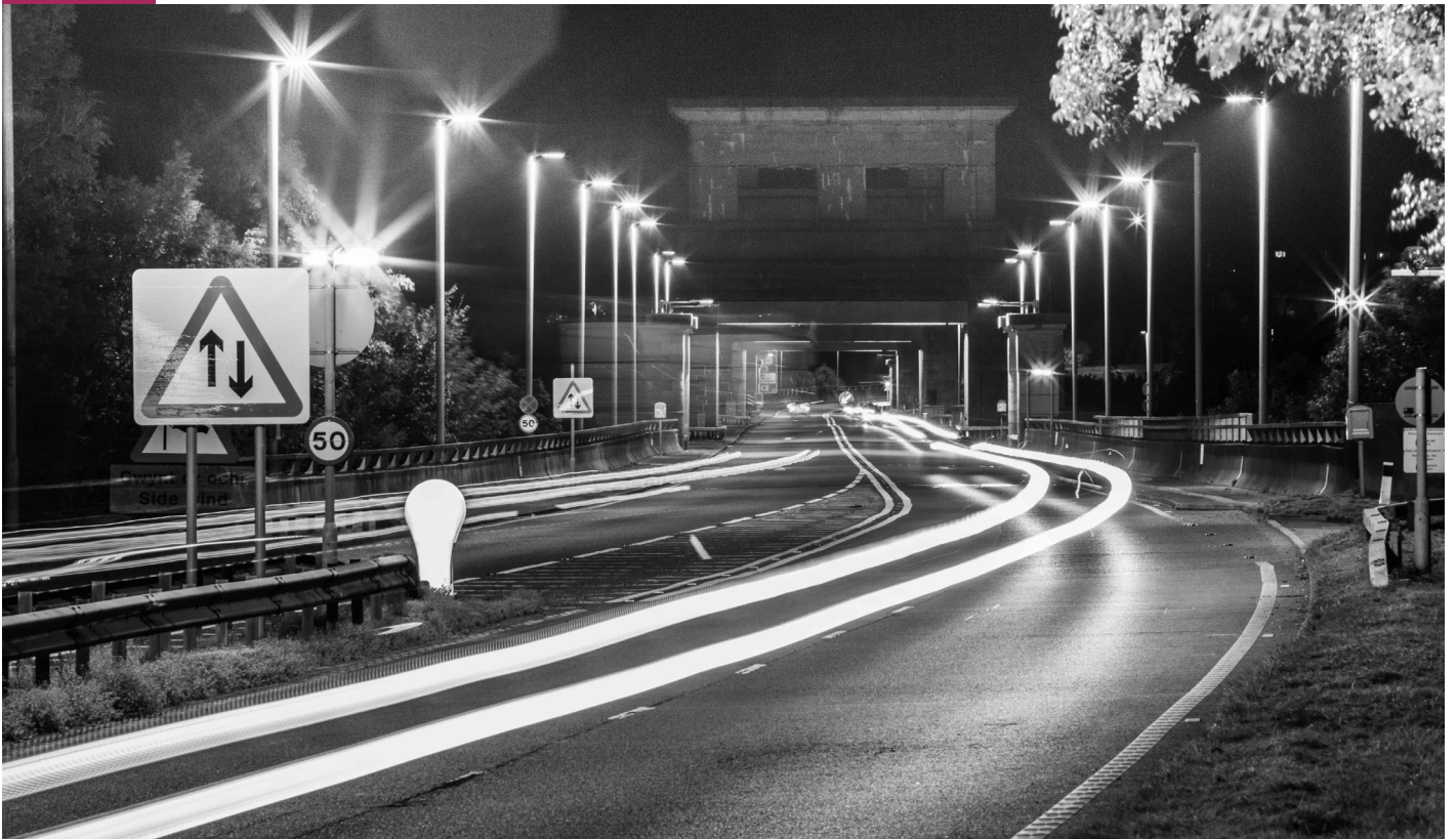
Yr A55 dros Bont Britannia The A55 over Britannia Bridge

At the same time, the A55 emphatically divides the island in a way that the old A5 did not. Thomas Telford's engineering masterpiece, completed with the Menai Bridge in 1826, allowed mail and stagecoaches to make a fast journey to the Dublin crossing, but communities were still joined, rather than bypassed, by the route. As traffic increased, new road schemes improved the quality of life for many villages but loss of footfall for local businesses was often the result. Thanks to the A55, though, employment