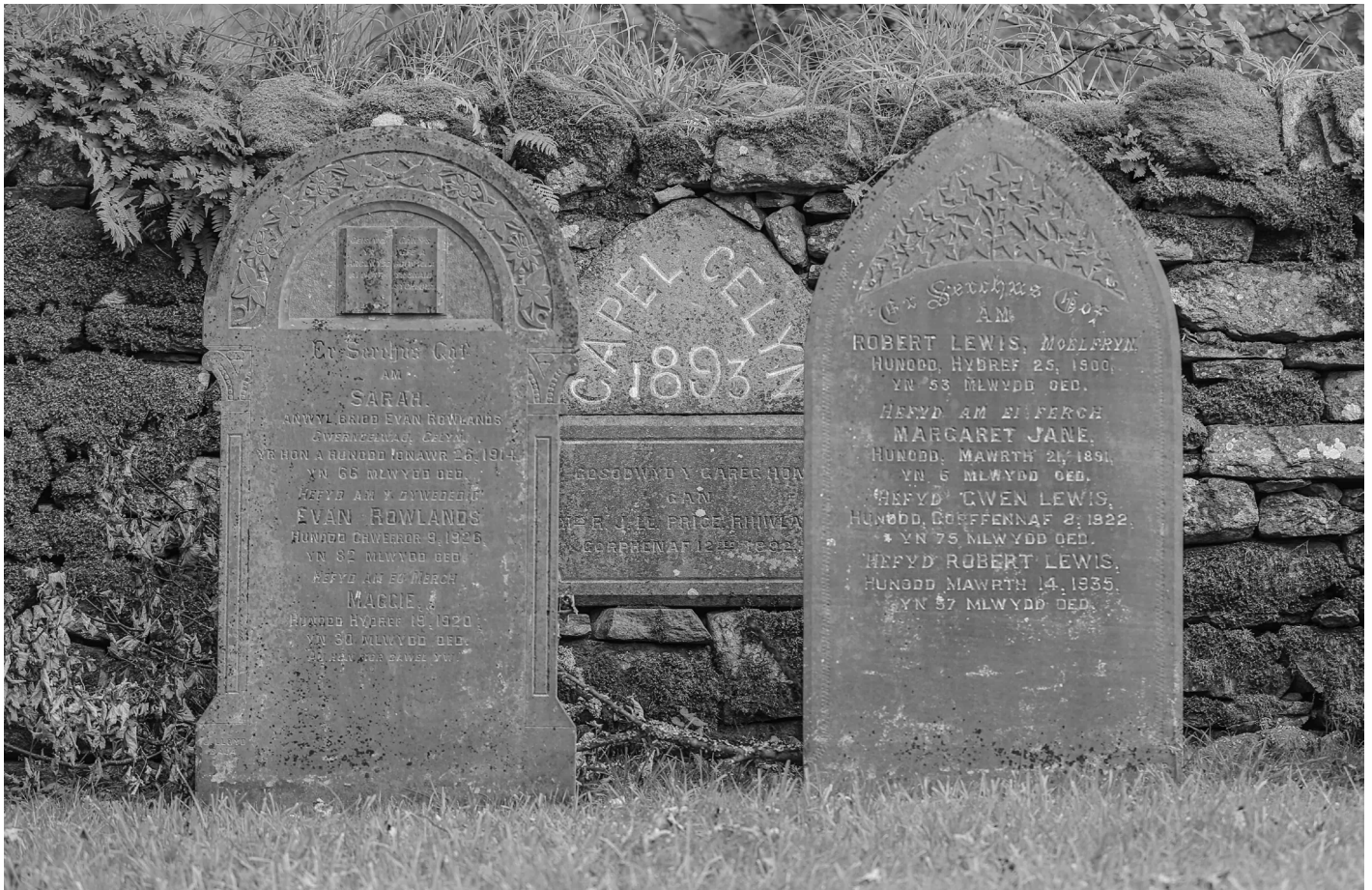
Cerrig beddau Capel Celyn | The gravestones of Capel Celyn