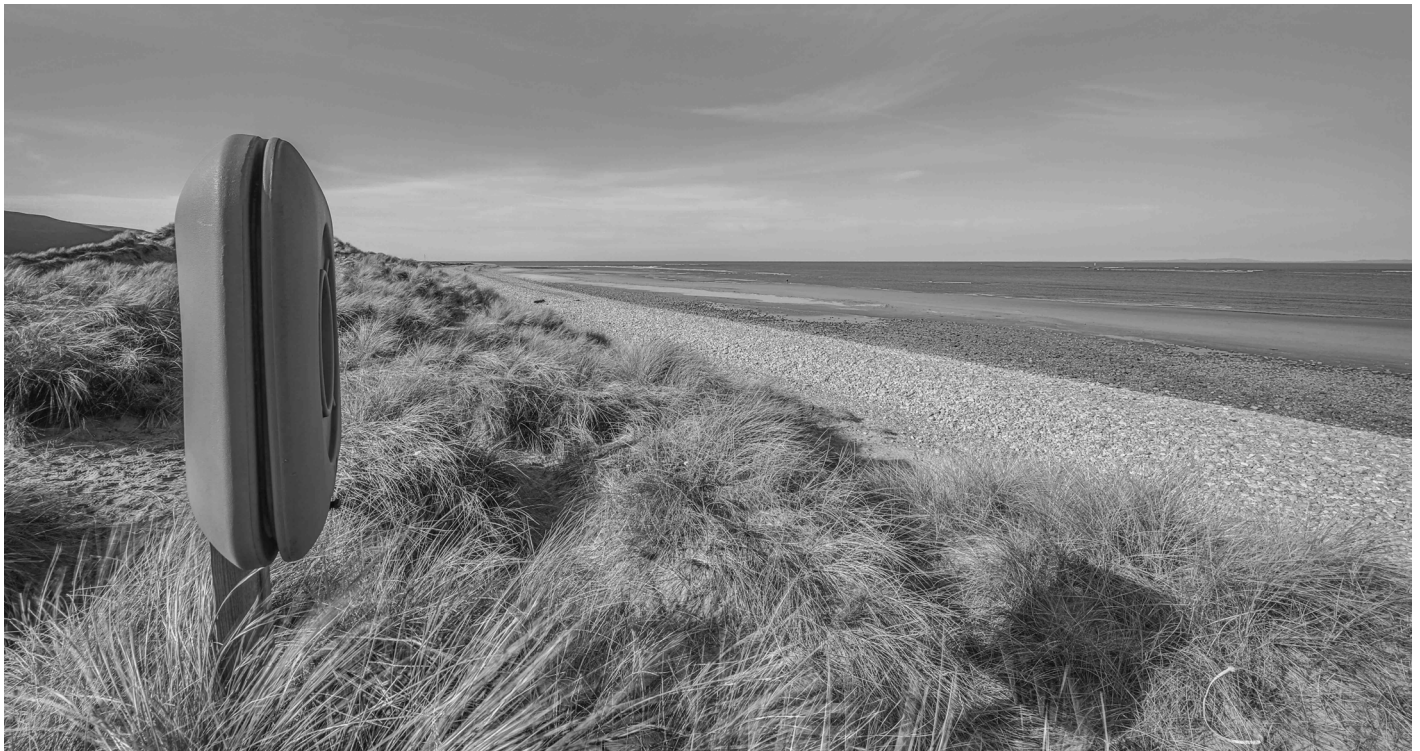
Tywydoedd Fairbourne The sands at Fairbourne