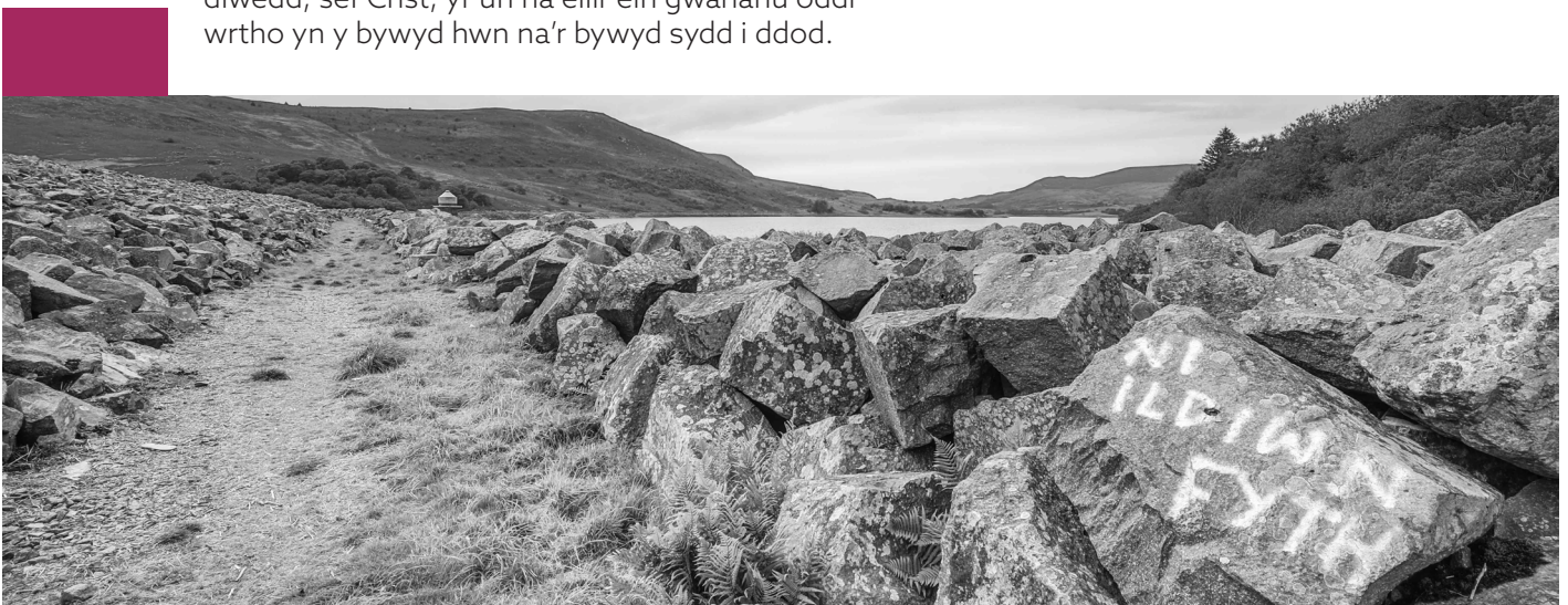
Ger Llyn Celyn By the shores of Llyn Celyn

The Christian hope is that at the end of the age we will find ourselves in the presence of an eternally just but also eternally loving Father. This allows us to face death differently, turning our passing from a matter of fear into a matter of preparing to be with the one who is our source and our destination, Christ from whom we cannot be parted in this life or the next.